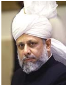
Hadrat Mirza Masrur Ahmad Líder actual de la Comunidad Ahmadiyya

Tras el fallecimiento de su fundador en 1908, la Comunidad musulmana Ahmadiyya ha sido liderada por sucesores elegidos denominados Jalifatul-Masih . El Jalifatul-Masih actual, Hadrat Mirza Masrur Ahmad, fue elegido en el año 2003 y es el quinto sucesor. El Jalifatul-Masih es el dirigente espiritual y ejecutivo de la Comunidad. La Comunidad a su vez se halla estructurada en varias organizaciones auxiliares para las mujeres, los niños, los jóvenes y los mayores.