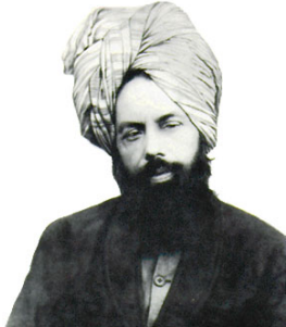
Hadrat Mirza Ghulam Ahmad (1835-1908) El Mesías Prometido e Imam-al-Mahdi Fundador de la Comunidad musulmana Ahmadiyya

En el aspecto económico, la Comunidad musulmana Ahmadiyya se autofinancia y es completamente independiente. Su principal fuente de ingresos son las contribuciones voluntarias y el espíritu de sacrificio de sus miembros. Además de responder a convocatorias ocasionales para recoger fondos para proyectos especiales, los fieles con ingresos donan a la Comunidad una parte específica de sus ingresos de forma regular. Por encima de todo, los miembros que de forma rutinaria dedican innumerables horas de servicios voluntarios para ayudar a la Comunidad a conseguir sus objetivos se cuentan por millones.