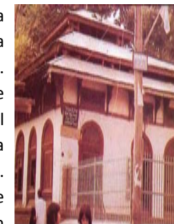
La Tumba de Jesucristo en Cachemira

La presencia de Jesucristo en la India está documentada en la literatura antigua de la India y de Cachemira. Jesucristo fue a Cachemira desde Tierra Santa durante el reinado del Rajá Gopadatta (49-109 D.C.) para proclamar su profecía a los Israelitas. Se le conocía como el Yusu (Jesús) de los hijos de Israel. Está escrito que un gran número de personas reconocieron su santidad y piedad, y se convirtieron en sus discípulos.